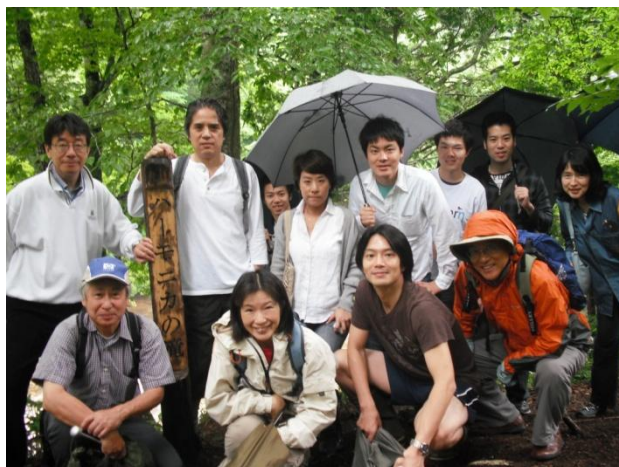
ハーモニカの滝前にて